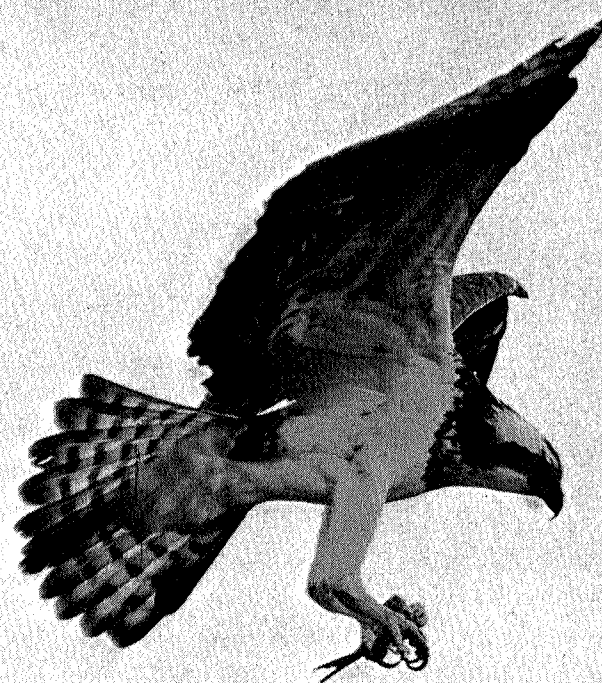
Fiskeørn i flukt.

Hetsen mot våre to ørne-arter nådde altså sitt foreløpige og urimelige klimaks i 1974. For selv våre myndigheter er klar over at ørneskadene er sterkt overdrevne. Men mens den ene representanten for vilt-forvaltningen sier at kravene er urimelige, sier den andre at den eneste løsningen på problemet er å innføre jakt på ørn igjen. Og mens store deler av kystbefolkningen som i mannsaldre har drevet med sauehold i de mest ørnerike distrikter og aldri har vært