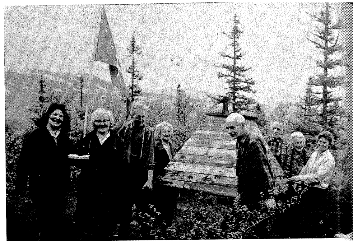
Søppelkassen flyttes, dugnad Græslihytta 1974.