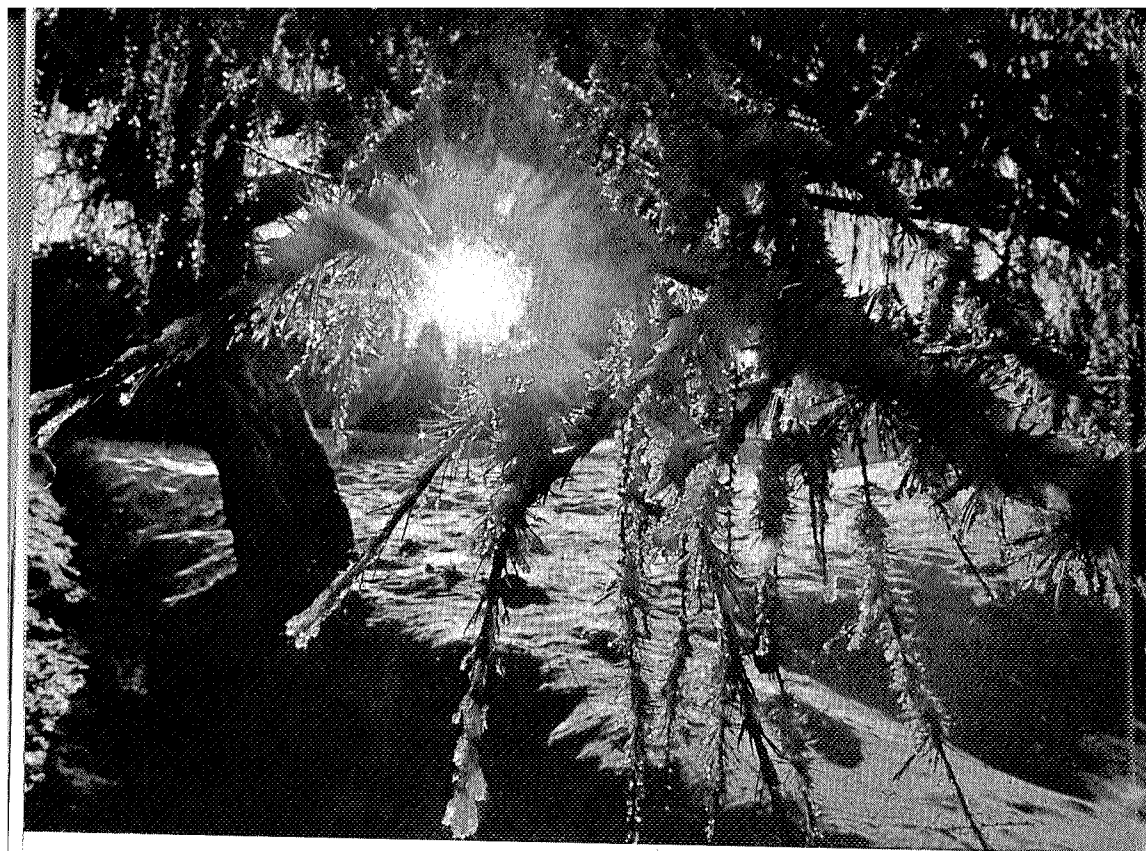
Vinterdag i skogen.