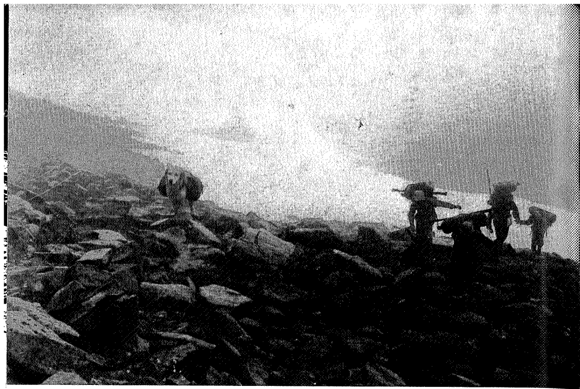
Mot Geithetta i tåke og regn.