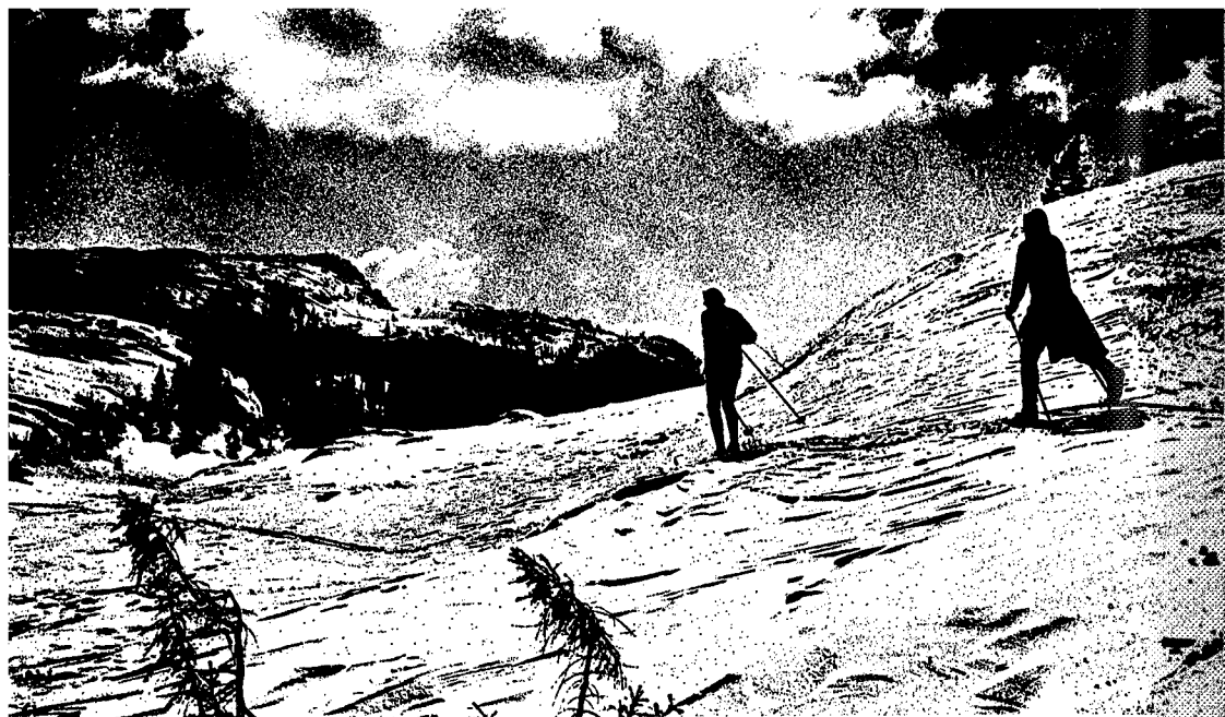
Eventyr i sort/hvitt.