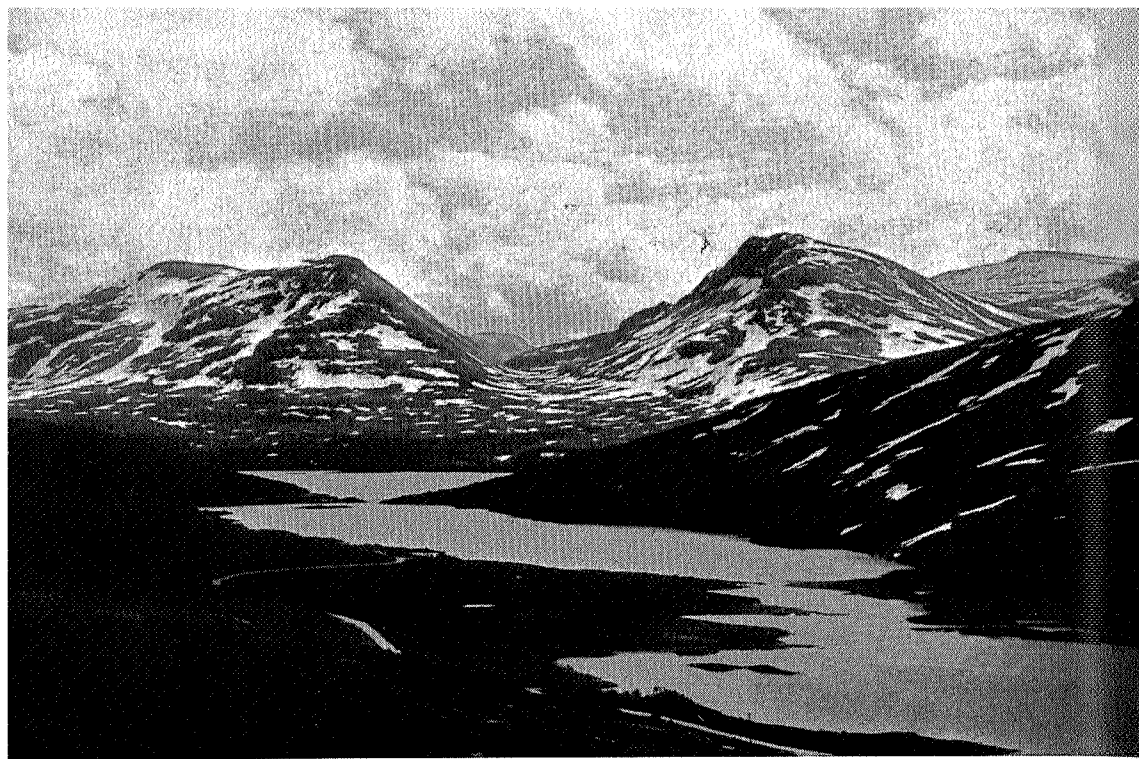
Tovatna sydover mot Ottdalen.