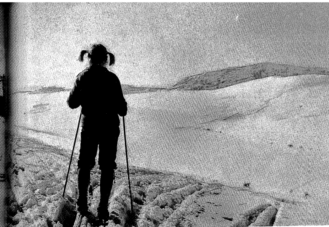
Mot Blåbø, påsken 1974

Ved elva Råna i ca. 500 m høyde finner vi et reservat på 500 da med hovedsakelig granurskog. Denne urskogresten er trolig noe av det mest genuine vi har av denne typen i hele landet. Elva Råna, terrenget omkring sammen med granskog med gjennomsnittlig alder på 250—300 år, gir området et nesten uvirkelig og trolsk preg. For det moderne mennesket, vant med velfriserte skoger er møtet med Råndalen et sjokk- og en tankevekker. Som kuriositet nevnes at den største målte grana er 32 m høy og ca. 1 meter i diameter.