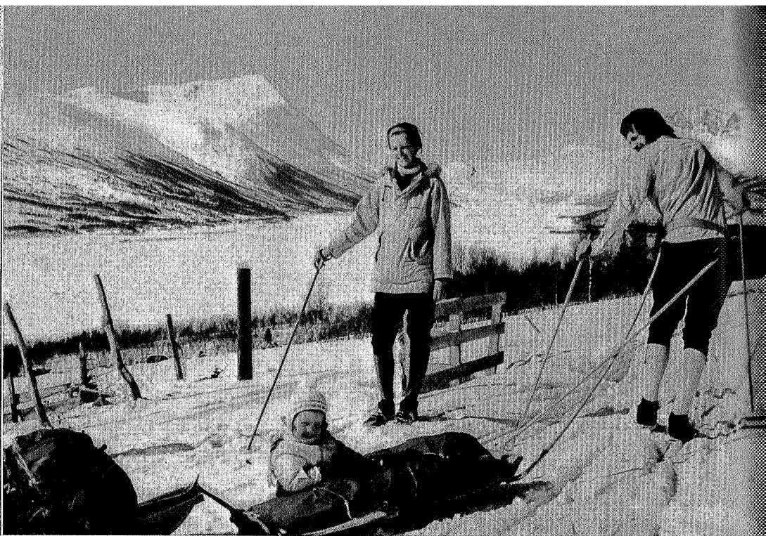
Fint å bli dratt til fjells.