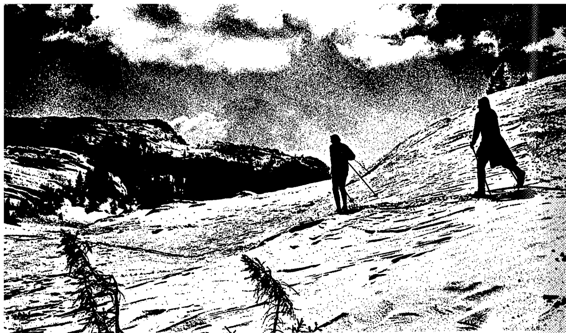
Eventyr i sort/hvitt.