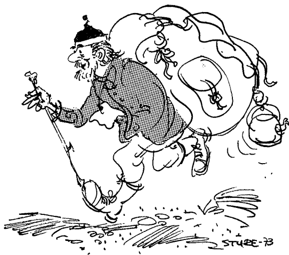
Verdens lykkeligste menneske?

Denne årvisse opplevelse har forøvrig satt såpass spor i vårt sinn at den har vært med å forme vår enkle livsfilosofi. Vi tillater oss nemlig å tro at dette med glede og lykke ikke er noe som kommer dalende ned til et menneske fra skyene. Vi tror det må en aldri så liten innsats til, man må yde noe, presse seg en smule, kjempe litt, så en får følelsen av å ha seiret, gjort seg fortjent.