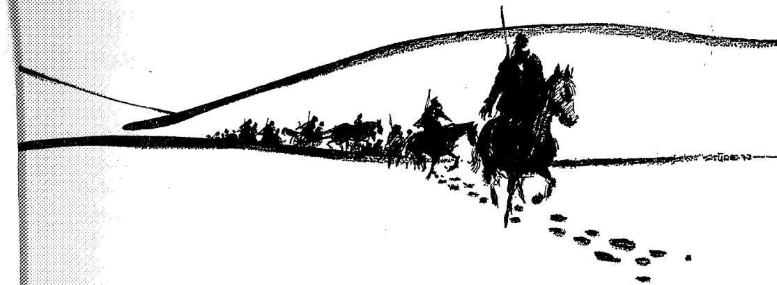
Svenskene brukte fire dager på retretten fra Meråker. Det var snøvær og kaldt i fjellet, og flere av soldatene frøs ihjel. Illustrasjon: Sture Lian Olsen.

Det er naturlig at en på svensk side forsøkte å unnskyldte seg for nederlaget. At det har vært styggvær i fjellet er neppe usant, men det er litt vanskelig å tro at det i slutten av august kan ha vært så kaldt at folk frøs ihjel. Og om så var, så forklarer det ikke hvorfor svenskene snudde i Meråker. Rehbind sier ingen ting om at de hadde store tap i Norge. Det kan kanskje skyldes at det siste av rapporten hans ikke finnes. En må vel også tro at det ikke ble