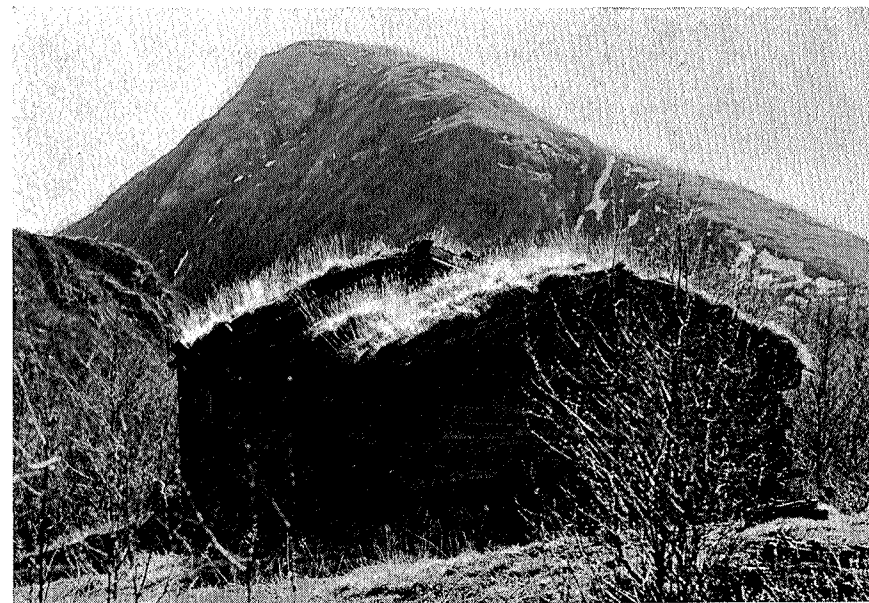
En gammel seter står og forfaller (ved Vårstigen).

Det blir derfor ikke så ofte at de gamle setrene har arealer og beliggenhet slik at vi kan ta de i bruk på samme måte som de nye fellessetrene. Men over alt hvor forholdene ligger tilrette må are-