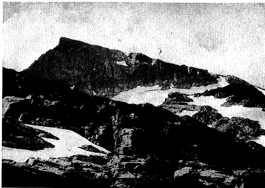
Vilt landskap mot Snota.