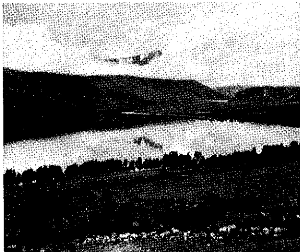
Gjevilvatnet og Okla en julinorgen.