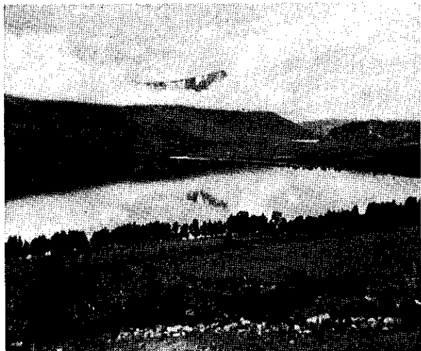
Gjevilvatnet og Okla en julinorgen.