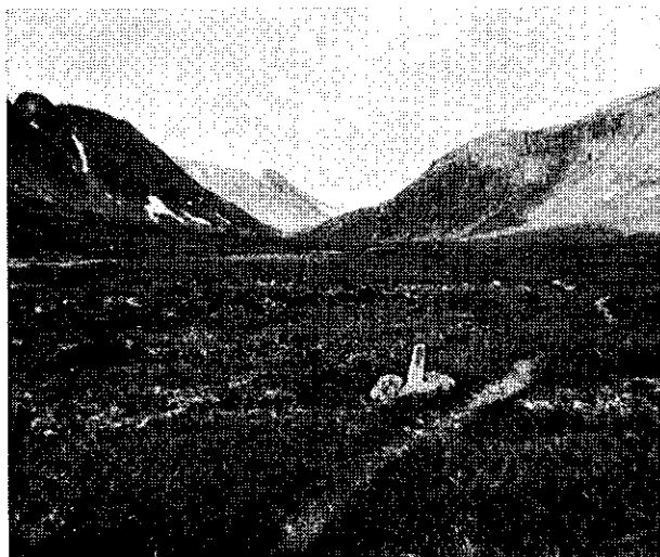
Stien mellom Blåhø og Gjevilvasskammene.