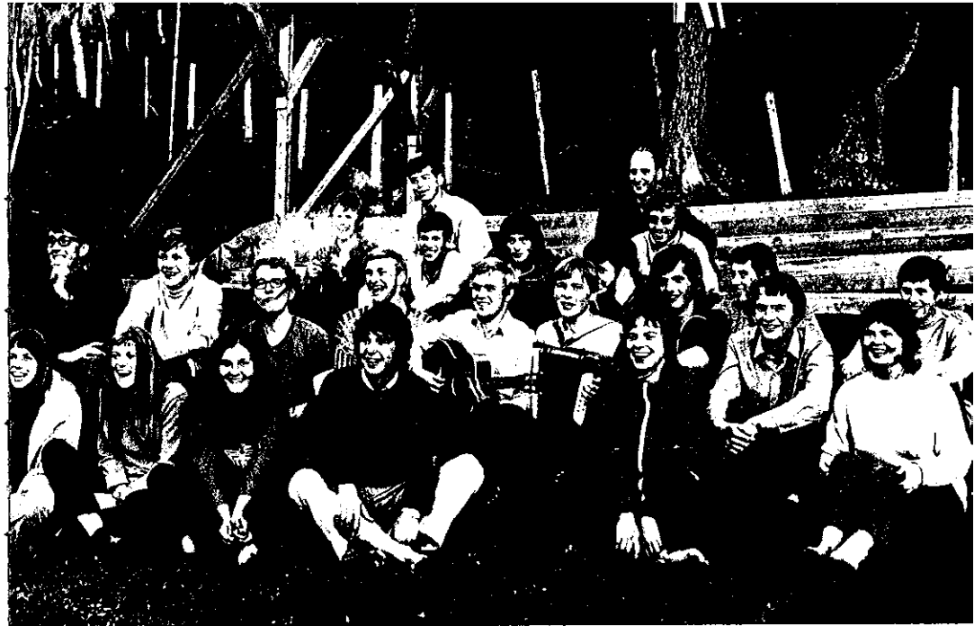
Gymnasiaster fra Tingvoll besøker Trollheimshytta.

Til venstre: God merking i alle retninger gjør det lett å ta seg fram i Trollheimen.