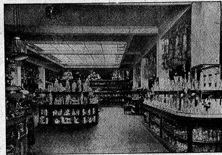
Interiør fra butikken