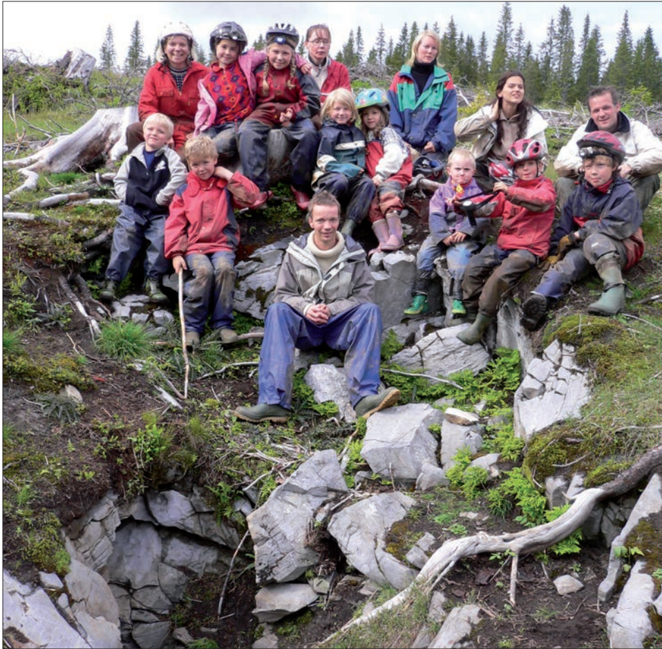
Barnas (Grotte) Turlag ved nedgang til Svartfossgrotta.

Jeg kjente til kalkgrotter i Rindal og Surnadal, ved Meråker og i Verdal og på Fosen, men på Hølanda? Kommuneansatte og lokalkjente venner bidro med tips og nye navn. "Hølet i Flå" visste alle om, ditto Jarlishola. Men Jutulhogget, eller -holet, og marmor? Nei. Fram med den nysgjerriges beste hjelpemidler: En telefonkatalog, kart og telefon. Etter ikke alt for mange telefoner hadde jeg lokalisert rett omgivelse: Jutuljtønna ved Baklihaugen. – Og snart en som hadde vært i Jutulholet som liten. Men topografi i telefon er enklere enn skitur i skumring. Vi fant ingen verdens ting ved