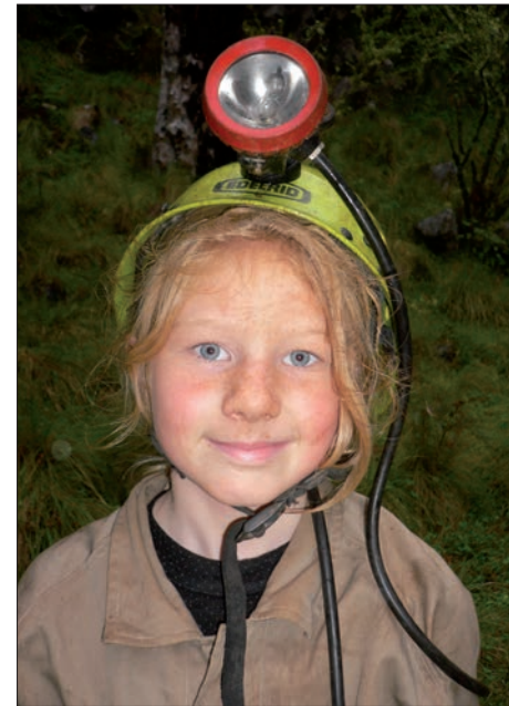
Jeg kom inn, - pappa var for stor.

Det er mange velkjente kyst- og brenningshuler langs hele kysten av Midt-Norge, men det er færre områder med kalk og marmor. Berg-grunnskart over regionen viser bare spredte, smale bånd av blått, håpets farge for grotteletere. I Rindalen, Surnadal, Rissa, Grong, Åfjord, Snåsa, Meråker og i Tromsdalen er det kjente grotter. Flesteparten av grottene er puslerier i forhold til grotte-systemene i Nordland, og få kjente er vesentlig lengre enn 100 m. Sannsynligvis er de aller fleste blitt til mot slutten av siste istid, - og nesten alle er aktive, med rennende vann som fortsetter utformingen. Grottene ved Gaulstad øst for Steinkjer skiller seg ut fra resten: De er omfangsrike og sannsynligvis dannet før siste istid. I store Gaulstadgrotta er det en vid hall med en foss som faller 17 meter fritt ned i et tjern. Om vinteren forvandles det hele til et underjordisk isslott. Veien inn krever dyp vassing under lavt tak, men synet der inne er verdt litt vinterbading