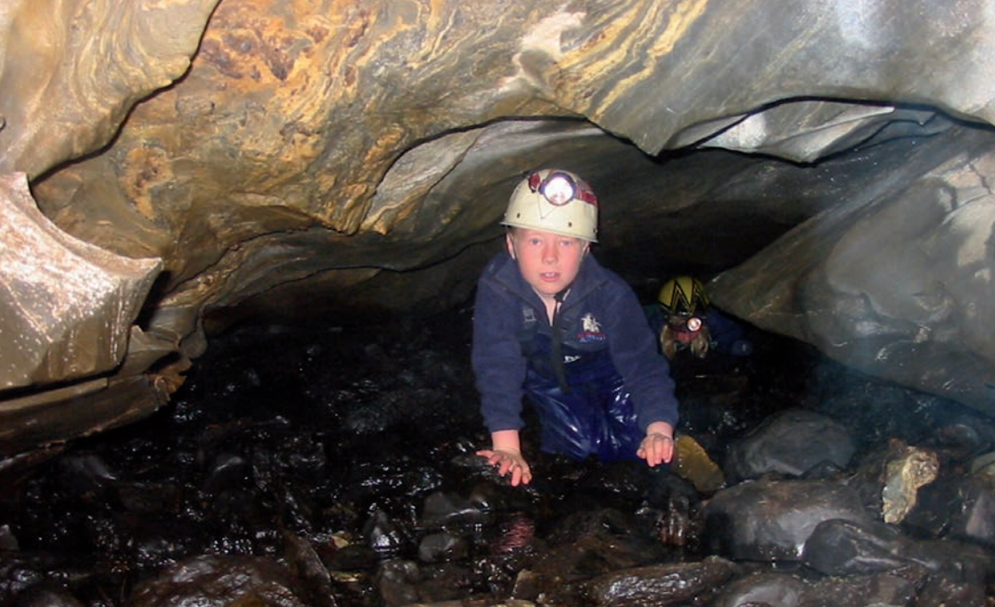
Store Svartjønngrotta krever kryping lengst inn.