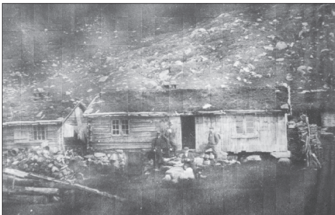
Boggevollsetra i Svartådalen var TT-kvarter fra 1888 og til 1905. Bildet er fra 1902.