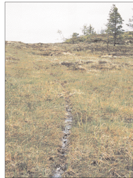
Oppunder toppen av Gullsiberget møtte jeg på disse sårene i terrenget etter motorsykkell.

Lenger opp, like oppunder toppen av ryggen inn mot Gullsiberget, møter jeg noe som langt fra gir den samme glede som møtet med skogens konge. Et stort antall spor av terrenggående motorsykler viser at heller ikke dette området er forskånet for dette moderne uvesenet. Hva er det som gjør at folk kjøper dyre kjøretøy for å frese gjennom utmarka? Kan ikke folk som liker motorsport og fart holde seg på vei og bane, og la friområdene være i fred?