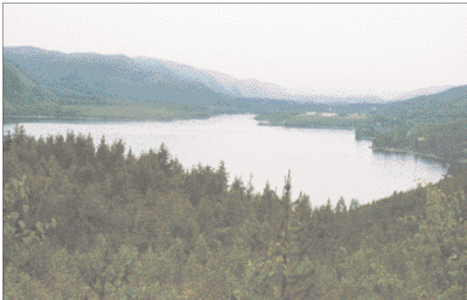
Farvel til Selbusjøen.

Det ble ikke noen hyttetur denne helgen. En lang vinters oppsamlede drømmer om sommer og fjell kunne, på tross av intens planlegging, ikke realiseres der og da. Pokker også! Midt i juni, og midt i en nordisk sommer som er så alt for kort. Når man har passert de femti blir man grådig på tid og naturopplevelser. Året snurrer fortere og fortere rundt – troen på at man har en uendelighet av fjell-opplevelser og utsikter foran seg begynner etter hvert å blekne.