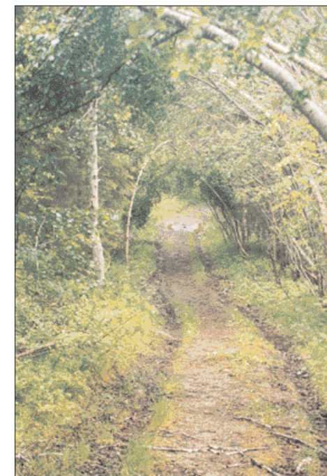
Den gamle og gjengrodd skogsveien mellom Espås og Almannaune er en flott opplevelse.

Og alt dette like i nærheten av storbyen Trondheim! Den urbane byen med cafeer og kulturtilbud, med tempo og trafikk. Det er ikke mer enn 23 minutter til stillheten, og så noen skarve bussholdeplasser før man er på plass i byen igjen. Det er dette som er blant de unike kvalitetene byen vår har. Kontrastene mellom det urbane på den ene siden og naturopplevelsene på den andre. Mangfoldet og valgmulighetene. Vi har mye å ta vare på!