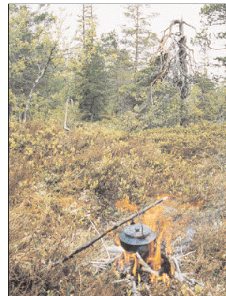
Intet smaker så godt som nykokt markakaffe.