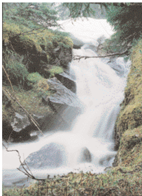
Vårbekk i Bymarka.

2/3 av grunnfondets avkastning overføres til driftsfondet og disponeres i henhold til vedtektene