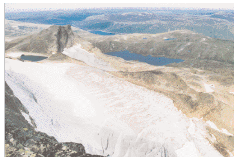
Breen sett fra toppen av Snota.