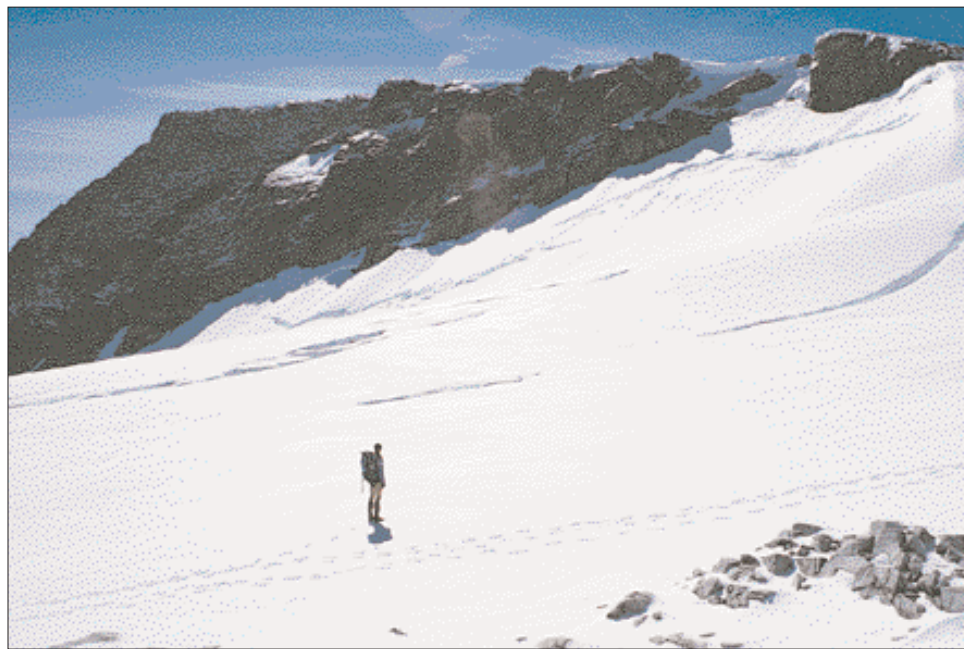
Allerede i slutten av juli var mye av overflatesnøen smelta bort og deler av sprekkssystemene blottlagt.

Ruta er merka inn på snøen på nordsida av breskjæret som avgrenser selve Snotbreen. Fra toppen av breskjæret der en møter Snotbreen, tar ikke ruta rett fram videre mot Snotryggen der det er mest naturlig å fortsette, men tar ut litt til høyre og slakere i vestnordvestlig retning fram mot den vesle fjellryggen som ender borte på bandet med tjonna mellom Litj-Snota og Snota. Følges ruta omgås sprekkene på selve Snotbreen. Fra bandet tar merkinga sørover bratt opp ura mot toppen av Snota.