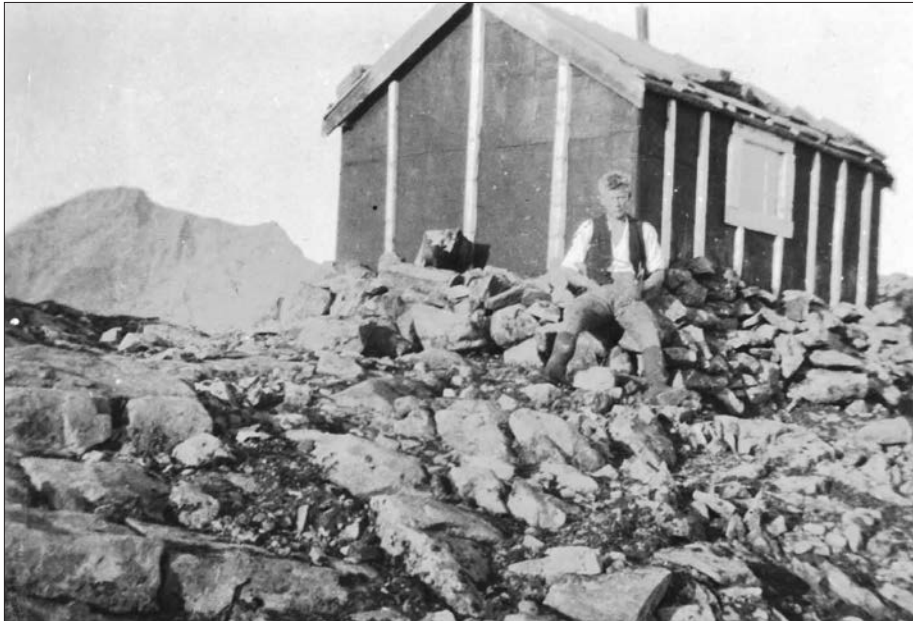
Bandaklumpen med Storsylen i bakgrunnen. August 1914.

Bandaklumpen har aldri fått særlig oppmerksomhet fra fotturistenes side. Den har ligget i skyggen av Storsylen som har stukket seg fram, bokstavelig talt, og vært det naturlige midtpunkt i drøyt hundre år. Men for de innvidde er forholdene litt annerledes. De to toppene er som et kjærestepar å regne. Skaret mellom de to toppene binder dem sammen. Med runde former og 200 høydemeter lavere enn Storsylen er det rimelig at Bandaklumpen er det svake kjønn. Når noen finner hverandre, er det andre som kan bli sjalu. Den rollen har Storsola der han står som nærmeste nabo i sør, og er nesten like høy som Storsylen, bare noen skarve meter lavere. Den viser sjalusien ved å sette nesen rett i sky klar til å yppe seg på mannfolks vis. Slik vil de følelsesmessige spenningene i dette området være i lang tid framover.