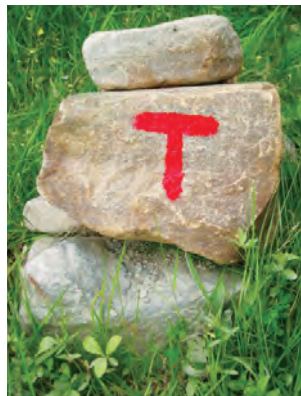
At sommer-rutene er merket med røde T-er betyr at en forening i DNT-systemet har ansvar for den.

TT kan trekke beløpet fra din konto. Vi anbefaler alle å bruke betalingsfullmakten. Da slipper du å dra på kontanter i fjellet. I tillegg har engangsfullmaktene medført at det ikke lenger er tyverier fra betalingsbøssene. Vær nøye og fyll ut alle rubrikkene. Da blir arbeidet lettere for dem som fører regnskap og står for proviantforsyningen. Ved å undertegne fullmakten gir du TT fullmakt til å trekke fra bankkontoen din det beløp du skal betale for