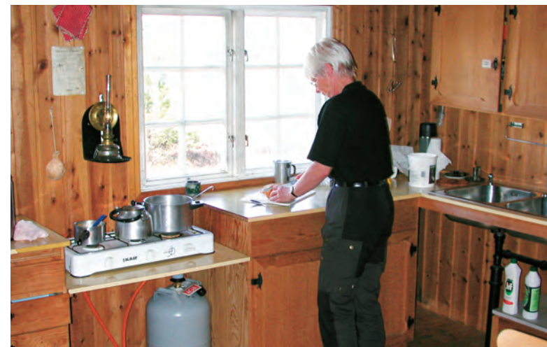
På Græslilytta i Sylan.

Det første du gjør når du kommer fram til hytta, etter at du har tatt av deg på beina selvfølgelig, er å skrive deg inn i hytteprotokollen. Hvem du er og hvor du skal, medlemsnummer, hvor du kom fra og hvor du hører hjemme i verden, alt skal inn i boka som fungerer både som regnskapsbok og besøks-