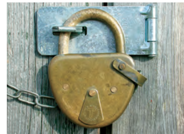
De selvbetjente hyttene er låst med DNT-standardlås. Medlemmer kan deponere på nøkkel som passer til alle hyttene.

Med unntak av hyttene i Barnas Naturverden, fjellgårdene Kårvatn og Bårdsgården som står åpen, er de resterende selvbetjente og ubetjente hyttene til TT låst med DNTs standardlås. Denne nøkkelen går til de aller fleste låste selvbetjente og ubetjente hyttene tilknyttet DNT over hele landet. Alle medlemmer av foreninger tilknyttet DNT får leie standardnøkkelen og kan ta med seg venner til disse hyttene, også ikke-medlemmer. Medlemmer betaler en vesentlig lavere pris enn ikke-medlemmer. Nøkkeldepositum er på 100 kr. Utenom TTs og NTTs kontorer og på de betjente hyttene (når disse er betjent) lånes det ut nøkler fra lokale utlånere. Opplysninger om lokale utlånere finnes på TTs informasjonsmateriell.