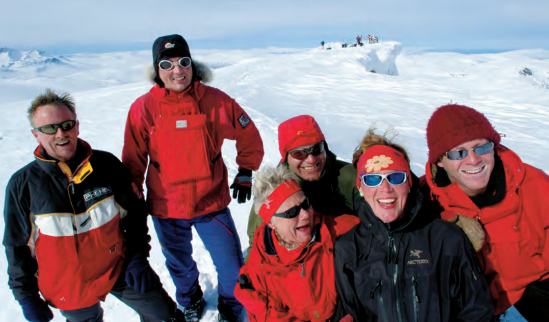
Fellestur til Blåhø.

protokoll. Så er det bare å finne seg en ledig seng. Skulle det være fullt, finner du en ledig madrass, på soverommene, på loftet eller det kan ligge doble madrasser i sengene. TTs selvbetjente hytter er tilgjengelige hele året.