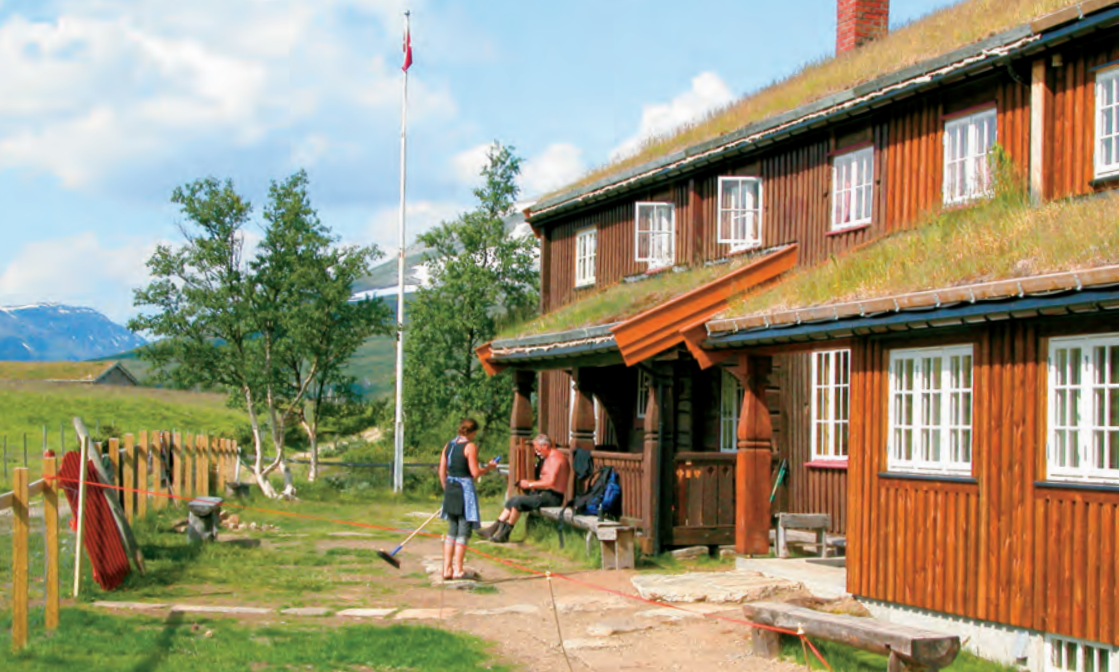
Jøldalshytta i Trollheimen.