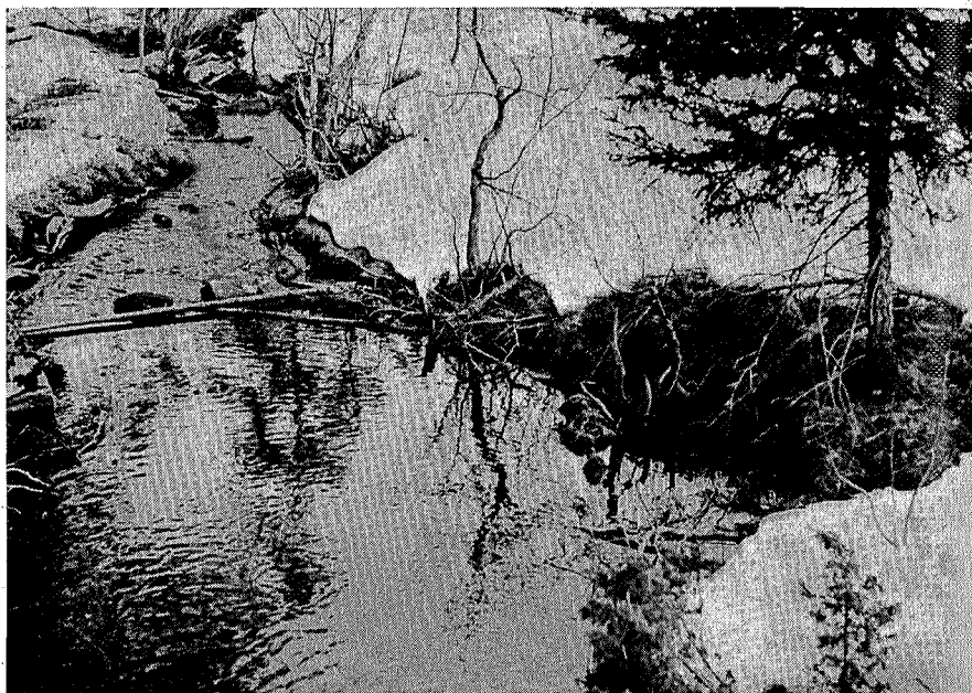
«Storelva» kalles ifølge kartet denne bekken, som går ut fra Vasselj-tjernet.