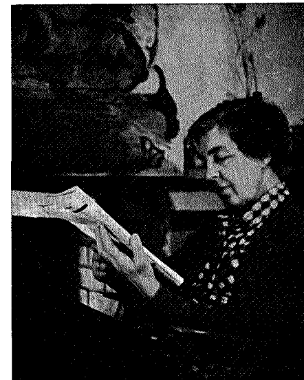
Fortelleren i peiskroken

Jeg er en av de heldige som har funnet mitt sted innen byens grenser og et sted som du kunne tro lå mange mil utenfor byens larm. Hvor mange er det som vet hvor Vassdalen, Søråsen og Stokkdalen ligger, og hvor mange har sett de blinkende småvann Jervtjønnnet, Metjønnnet og Stokdalstjønnnet, som du passerer når du forlater Nedre Jervan og begir deg oppover mot Malvikmarka. Har du sett utsikten fra Solemsvåtten, som vel kan måle seg med utsynet fra Gråkallen, eller fra høyden ovenfor Kuset hvor du har et praktfullt rundskue over Jonsvannet med dets øyer og bukter som minner om en vestlandsfjord. Har du sett solen rinne en vårmorgen du har vært tidlig oppe for å høre århanespellet oppe ved Åsgjerdet, mens svarttrosten har hilst solen fra grantoppen du passerer på veien oppover.