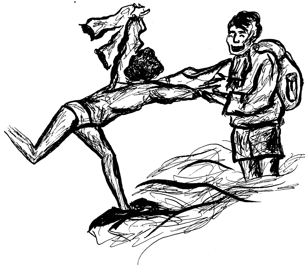
Skaperens raffinerte mesterverk åpenbarte noen av sine attributter —

Også værgudene mistet besinnelsen denne dagen, idet de overøste oss med et sinnssvakt skybrudd. Dette medførte at enkelte av strøkets bekker i begeistringens rus overgikk grensen for det sømmelige. Men også dette viste seg å få en positiv verdi. Pålitelige kilder hevder at naturens lunefulle opptreden forårsaket epokegjørende sjelsinntrykk hos opptil flere av de mannlige fjellturister. Under heimturen hadde nemlig en flomstor bekk stanset den videre ferd for en stund. Og i første øyeblikk virket situasjonen håpløs for det svake kjønn. Men som så mange ganger før, fant de også her på intuitivt vis sin løsning. Jentene kvittet seg ganske enkelt med det vesentligste av klesplagg under beltestedet. Og ved hjelp av den mer garvede del av det mannlige klientel, imøtekom man naturens uberegnelige krefter i fellesskap. Skjebnen tillot altså at Skaperens raffinerte mesterverk åpenbarte noen av sine attributter — en minnerik begivenhet, som for enkelte medførte visjonært klar-