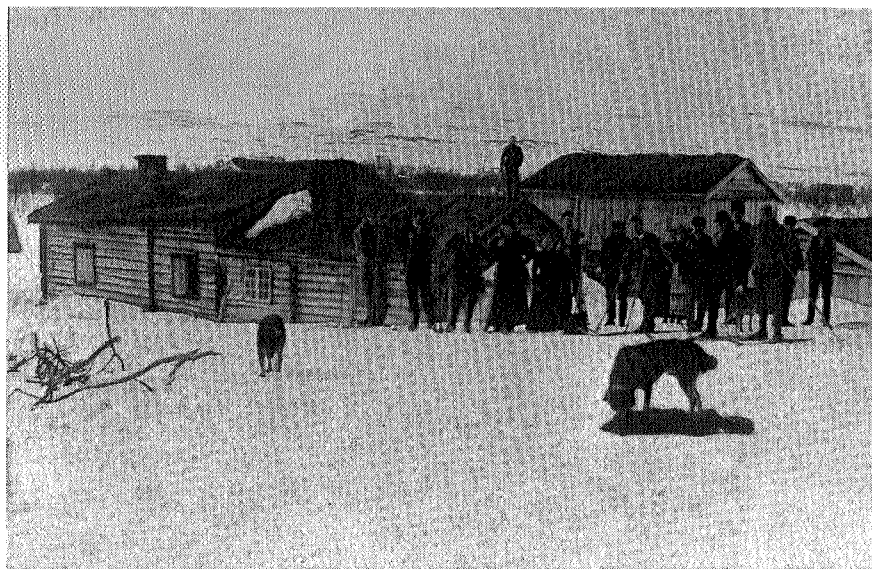
Nedalen gård, Påsken 1896.