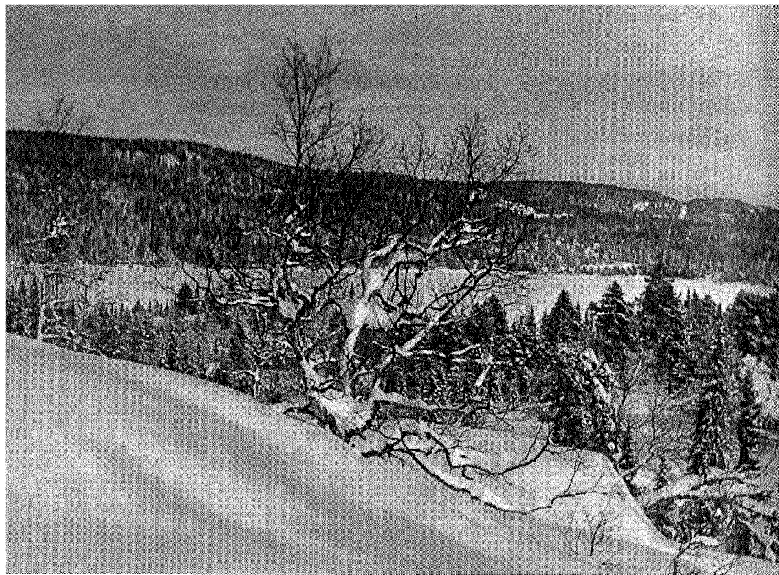
Skjellbreia, fra vest.