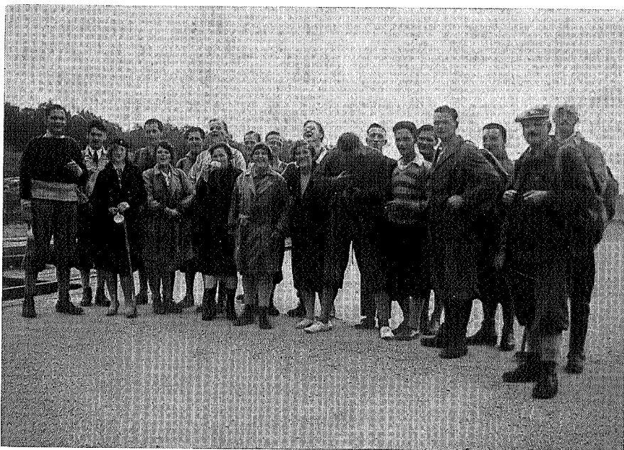
Første fellestur til Snøbetta.