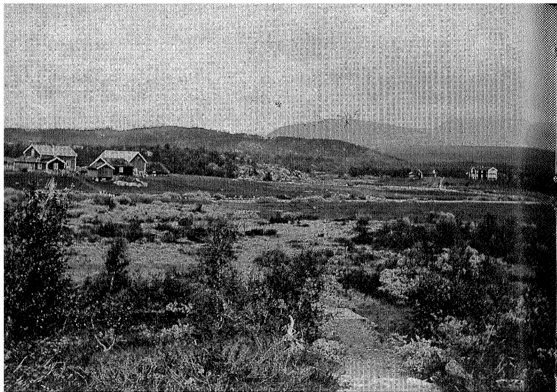
Hyddkroken øst for Aursunden.