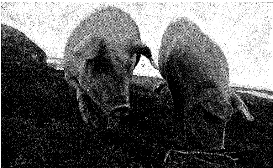
Griseparet på Gjevillvasshytta tok en fjelltur til Jøldalshytta, sommeren 1968. Hjemturen foregikk med traktor og lastebil. Det ble prima mager gris. En turist benektet å ha hatt grisefølge. Aunemo.