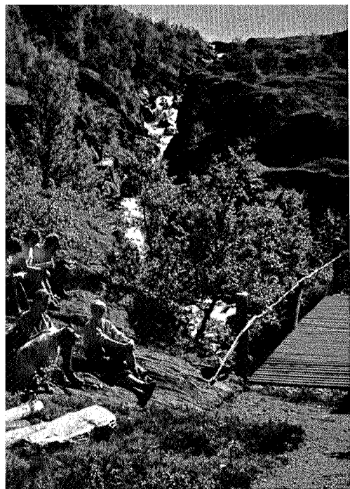
En pust i bakken ved nybrua

Tenke seg til gleden da vi under turen i sommer, fant en ny og helt fersk bro over Vårstigåa, som Telegrafverket hadde bygget bare én uke før vi kom. Alle som én var vi statsbedriften takknemlige for hjelpen med den gilde broen som var ført opp av impregnert materiale og liketil forsynt med rekkverk.