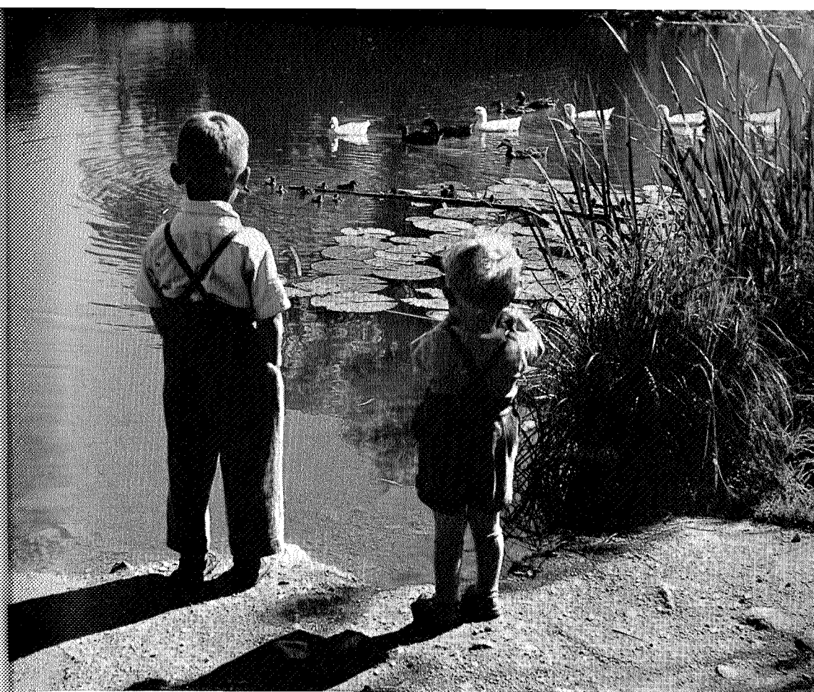
Et av de mange motivene som begeistret meg

Og hvilke øyne som ble satt på lerretet da jeg fikk se fargebilder fra steder jeg selv hadde gått. Disse fargene kunne umulig finnes. Jo, de var der i rik mangfoldighet og i god blanding, som de bare finnes i naturen selv. En vinterdag jeg trodde var bare sort hvit