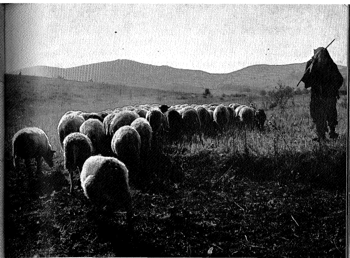
Den greske gjeteren inspirerte til dette «knipset»

En tur utenfor grensene kan ikke tenkes uten at bilen er godt lastet med fotoapparater og film. Siste sommer ble det Jugoslavia og Grekenland. Familiens øvrige medlemmer, som før så meget skeptisk på mine mer eller mindre vellykkede ekspedisjoner uti fotograferingen, er nå blitt merkelig interessert. Rett som det er