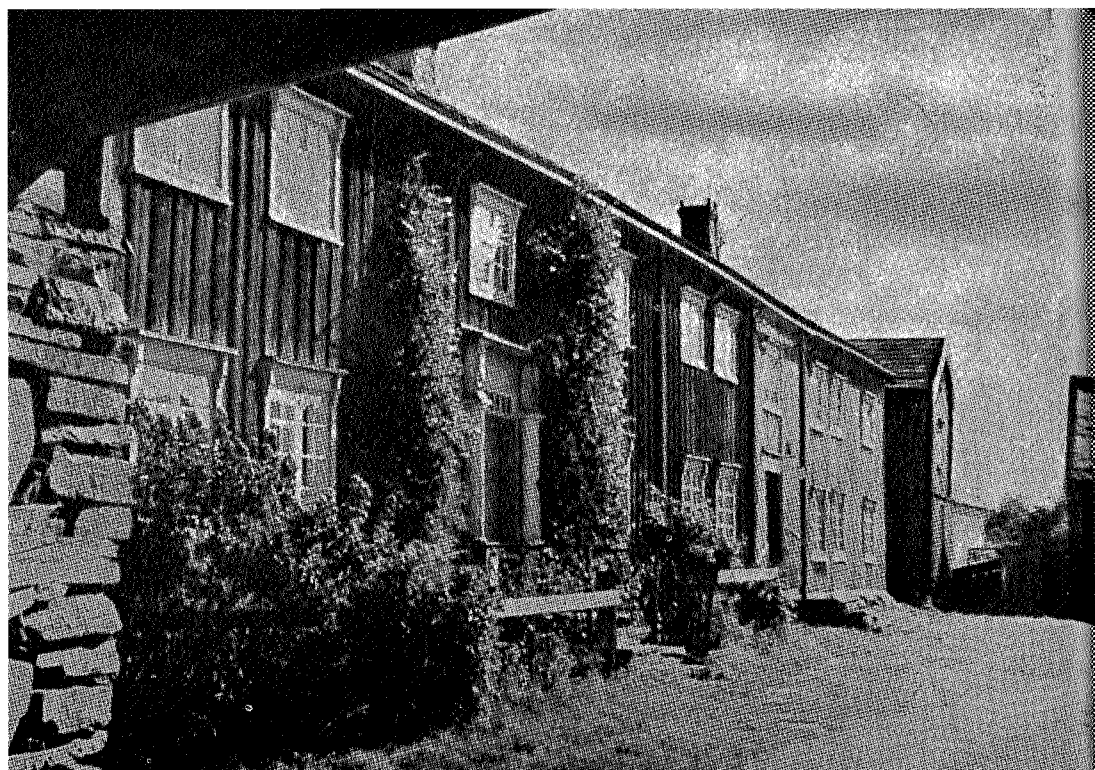
«Inn på tunet»

forstyrrende. Vi må vise respekt for det som er overlatt oss fra en tid hvor de arkitektoniske krav sto høyt. For enten en reiser nord eller syd i Trøndelagsfylkene, vil bebyggelsen, slik den er overlatt oss fra tidligere tider, være med til å karakterisere bygdene. Det er en felles tone som hører Trøndelag til i arkitekturen, enten det er store gårder eller småhus, og denne tonen skal vi prøve å bevare. Og i dette gjelder det først og fremst å holde på trønderlåna som et aktivum vi har, fremfor andre deler av vårt land, og som vi med rette kan være stolt av.