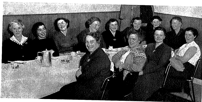
Vertinnebesøk i Trondheim.