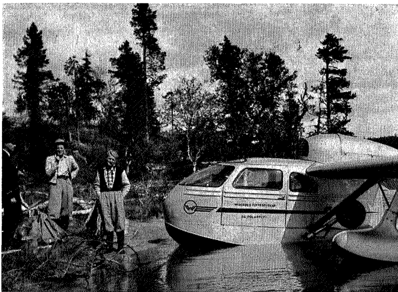
Widerøe flyr sportsfiskere til Grønningen i Snåsa