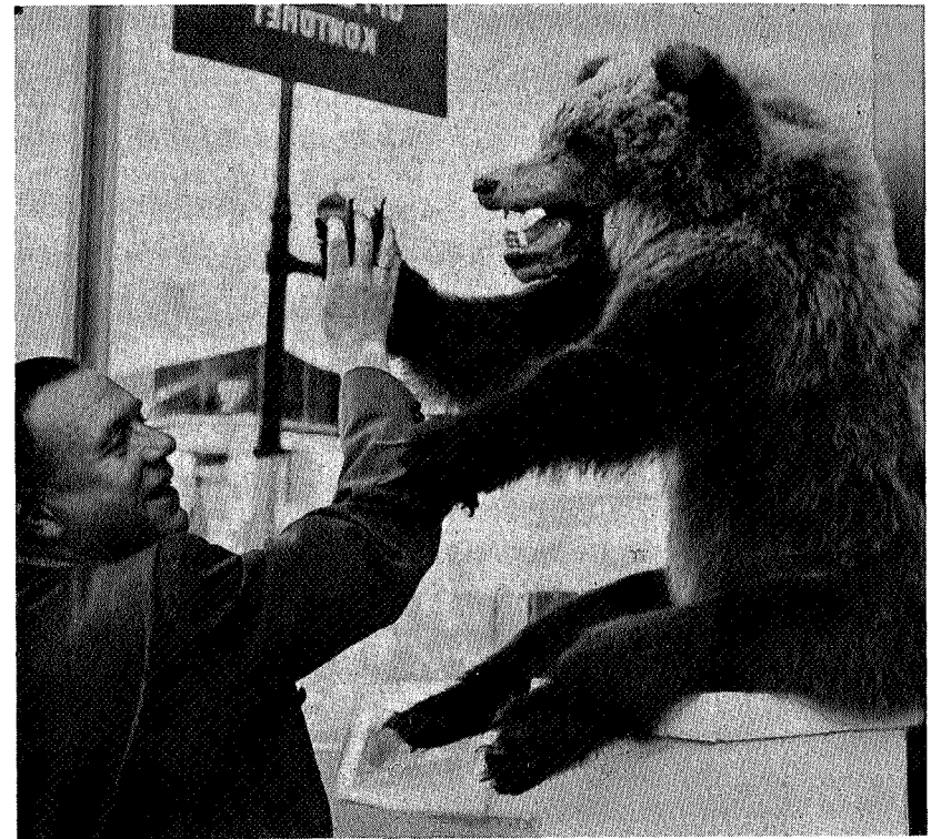
To bamser håndhilser

Etter hvert som menneskene har utviklet de tekniske hjelpemidlene sine er inngrepene deres i naturen vokst i styrke. Vi kan