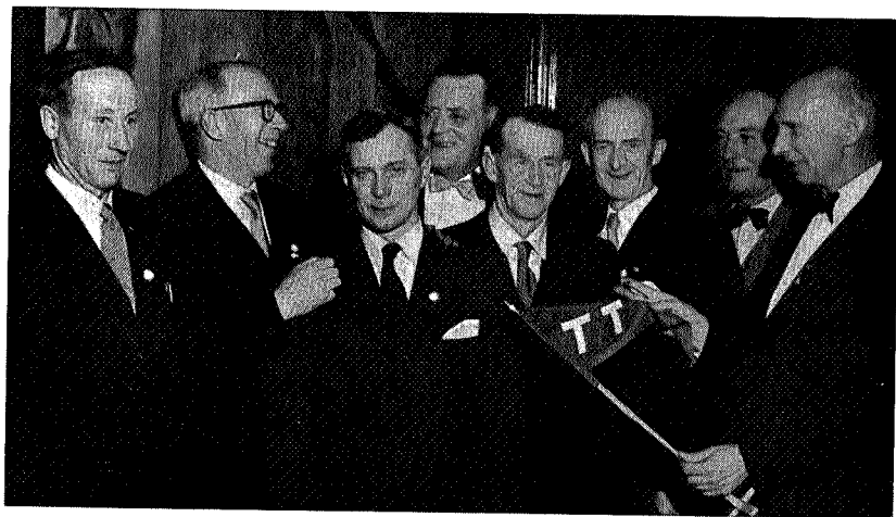
Våre nye hedrede.

For å utføre overnevnte arbeidsoppgaver beskjefstiger kontoret, utenom forretningsføreren, 2 faste kontordamer. Til slutt kan nevnes at husnøden også har gjort seg gjeldende for Trondhjems Turistforening's vedkommende, slik at det har vært vanskelig å skaffe høvelige kontorlokaler. Det må derfor være et mål for framtiden å skaffe foreningen bedre lokaler som ligger mere sentralt til.