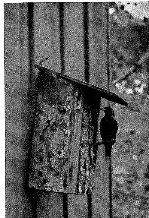
En trofast ektemann

propaganda helt fra småskolen av, både i by og på land. Store deler av befolkningen mangler nå både friluftskultur og forståelse av dyrelivets verdi. Samtidig er det altfor mange som ser på ville dyr og fugler bare som objekter for fangst og jakt, uten tanke på bevarelsen. Det opplysningsarbeid og den propaganda som må til, krever innsats ikke bare av enkeltpersoner, men av skolene og av alle foreninger som har tilknytning til naturen. Her har turistforeningene en oppgave, og Trondhjems Turistforening vil gjøre en god gjerning ved å ta saken opp.