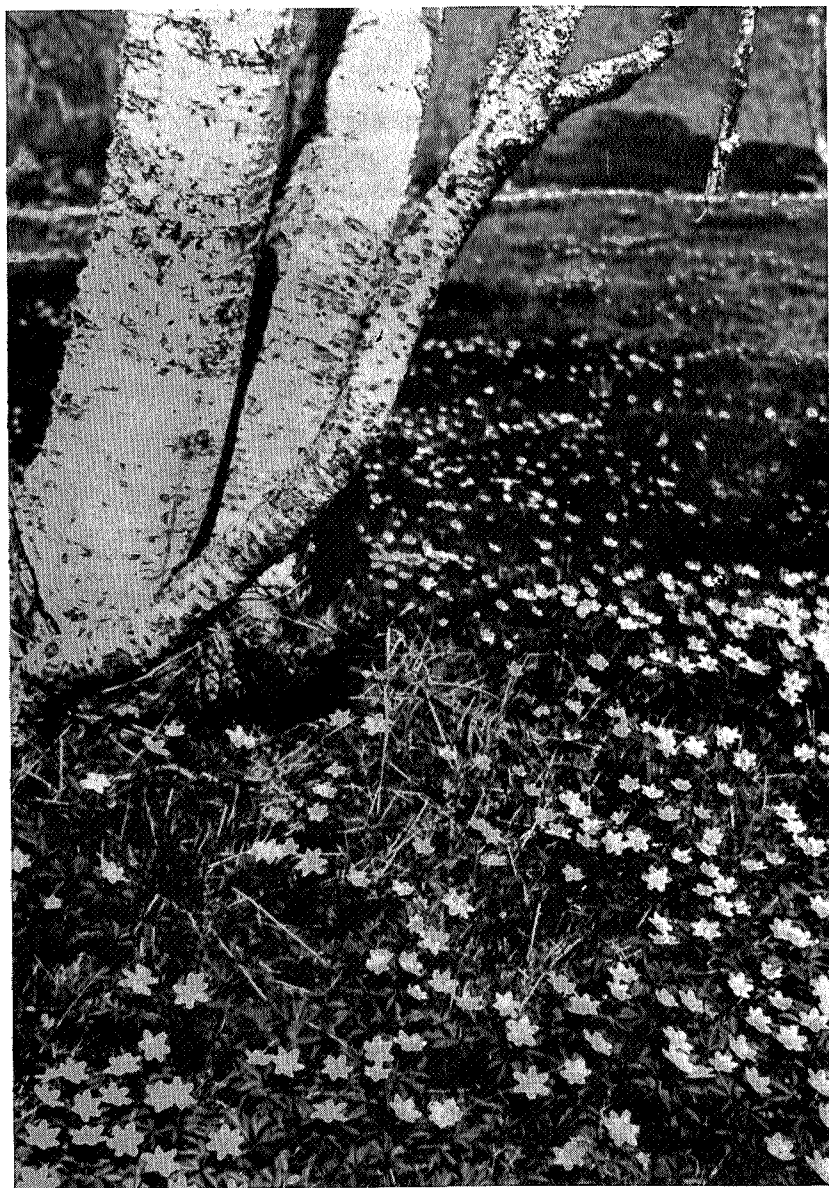
— — — — i den blir som'ren til