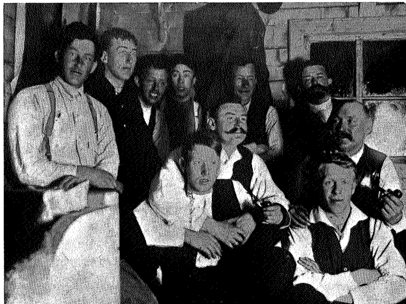
I gammelhytta på Storerikvollen.