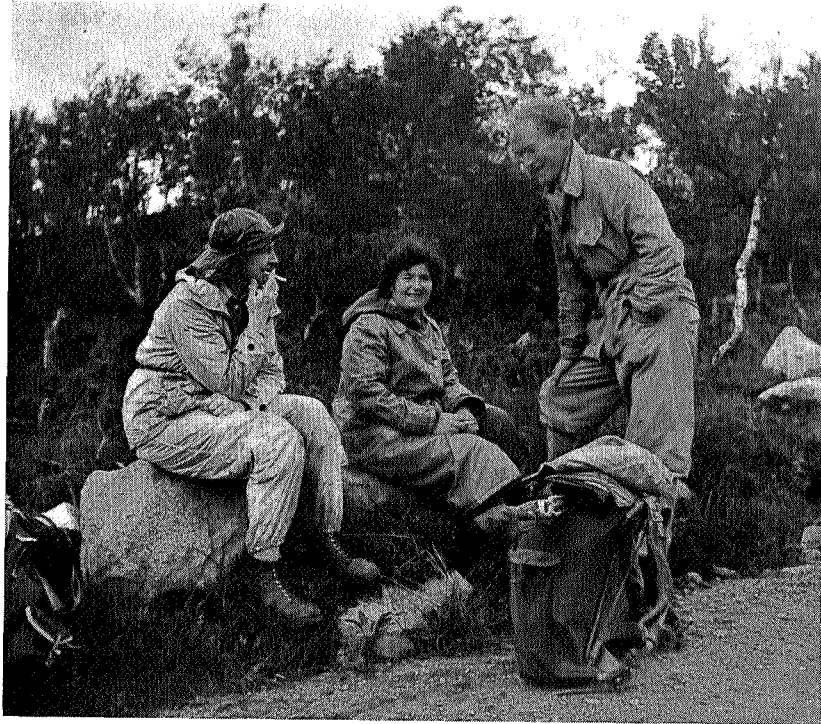
En god historie på kanten.