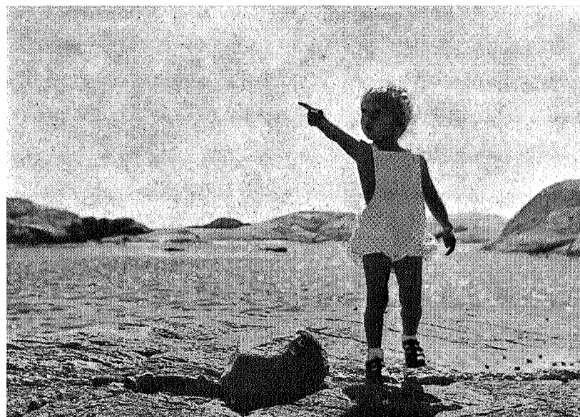
Vår og sommer.

Under Vor Kongl: Haand og Seigl F: R: Thot, Wedel, Basballe.