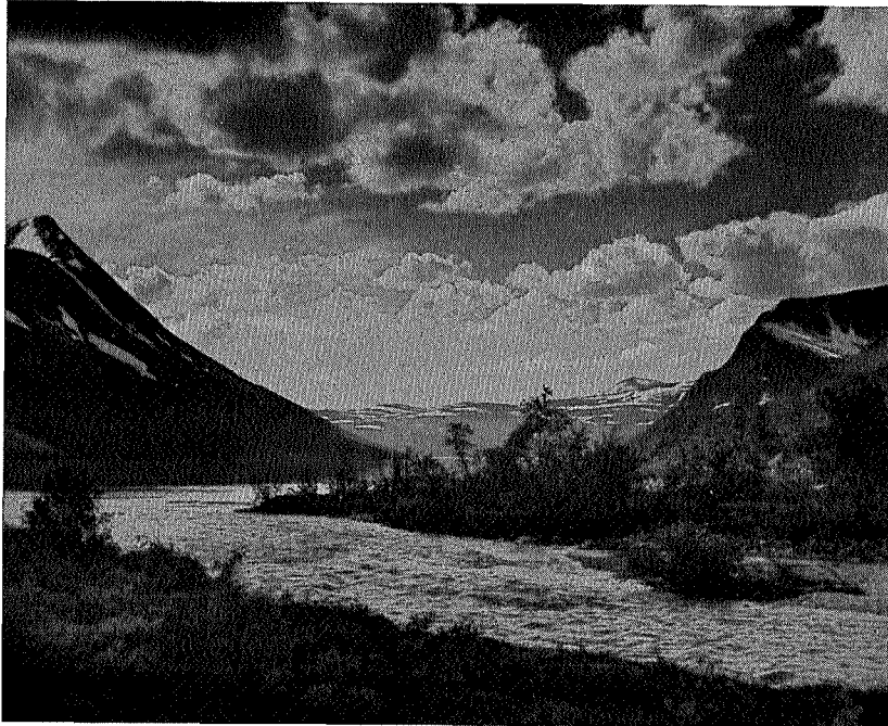
Fra Gravbekkens utløp i Gjevilvatnet.