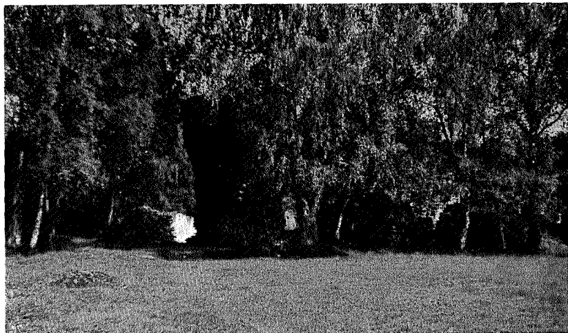
Mellom hvitstammede bjørker og grønt løv skimter en mørke, uregelmessige murmasser