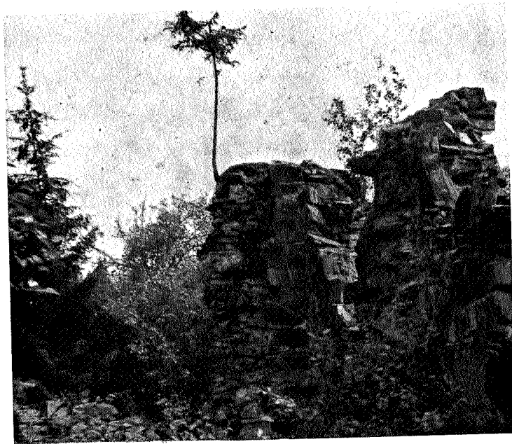
Nordøstre hjørne med grantre