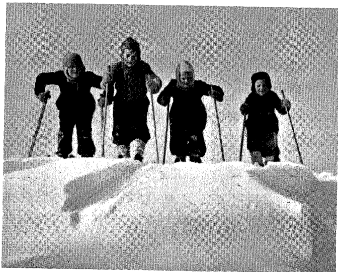
Det må krøkes i ti...