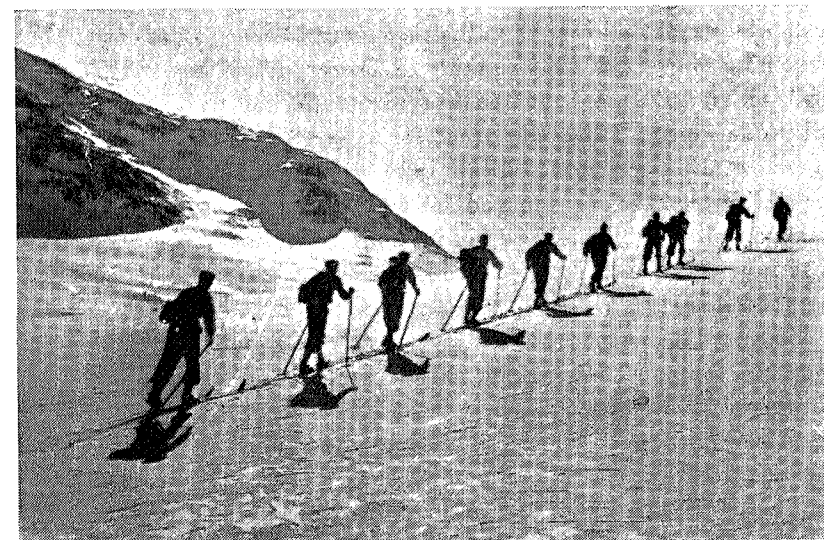
Bort fra lesesal og pugg — fram til snøkvite vidder.

Det er laget en firemannskomite som ordner alt og der vil bli 5 eller 6 partier, hvert på ca. 35 gutter som blir borte 1 uke. Takket være bidrag fra forskjellige bedrifter og firmaer, samt betraktelig reisemoderasjon er prisen blitt latterlig liten. Noen av guttene regner ut at det er like billig å dra tilfjells som å oppholde seg i Trondheim.