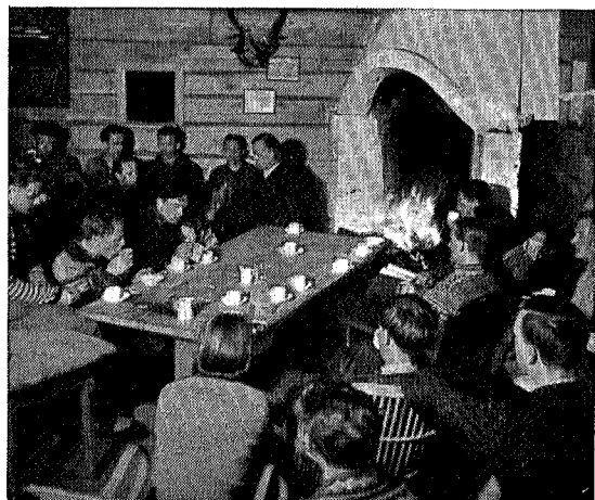
Studentikos stemning på Trollheimshytta.