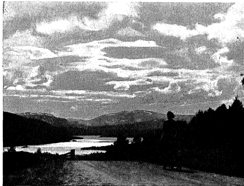
Søvatnet med Ruten