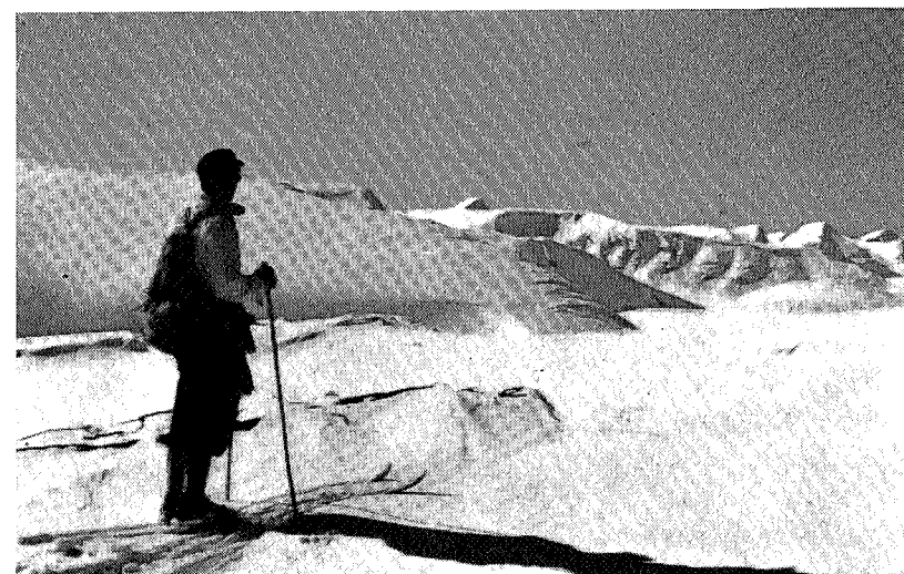
Mot Neådalssnota og Storlifjell

Vi legger i vei med noen store sløyfer til å begynne med for «å føl hain litt på teinner». Slalåmskiene riktig freser mot den grovkornede snøen, farten øker, vinden plystrer rundt ørene, tårene triller, du verden for en utforkjøring! Seks-syv svinger går fin-fint, vi gripes av en vill fartsrus og legger kursen rett ned mot krateret. Det bruser og syder, det er som å stå under en foss, stadig nedover går det ville jag, og side om side suser vi ned i krateret med en fart som et hurtigtog vilde bli grønt av misunnelse over. Nedover «låvebrua» har dessverre solsteken ødelagt føret en del så farten avtar betydelig, men det er fremdeles hengebratt og morsom «schusskjøring». Vi møter her bridgepartiet som sliter og klyver oppover i sitt ansikts sved i solsteken. Ved foten konstateres at vi har brukt 3½ minutt ned, derav knappe 2 min. til krateret. Vi er enige om at make til utforkjøring skal man lete lenge etter, og på et bedre føre i løypas nedre del skulle det være interessant å se hvilken tid den kan kjøres på.