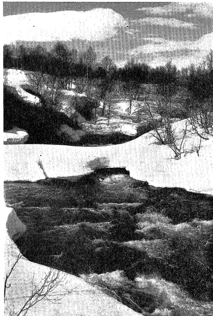
Fra Gjevilvatnets utlop