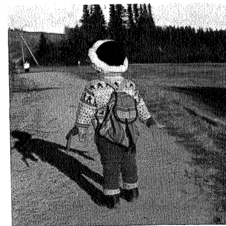
- - - krok skal bli