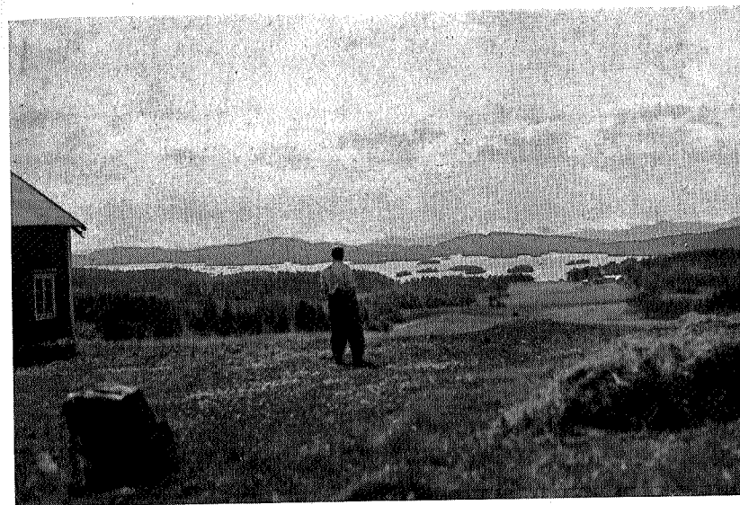
Utsikt fra Gravåsen — Storvatnet

Det som gjør Storvatnet så egenartet er den forrevne formen det har. Lange nes og små tanger stikker ut overalt, og drysset ut over vassflata ligger øyer, holmer og skjær, tallrike som dagene i et år. Ser en Storvatnet fra Nordgårdan, er det som en veldig samling av store og små vatn. Her kan en sannelig snakke om de tusen sjøers land. Men så har da også vatnet en strandlinje på 60 km. Og forrevet som vatnet, er også lendet omkring. Mot øst er det som en Jotunheimen i miniatyr. Heier og fjell blåner i alle retninger: Trånåheia, Kjørheia, Kjerringklimpen (den høyeste, 610 m.), Munkken, Østerheia, Grønliklimpen og Valheia for bare å nevne noen