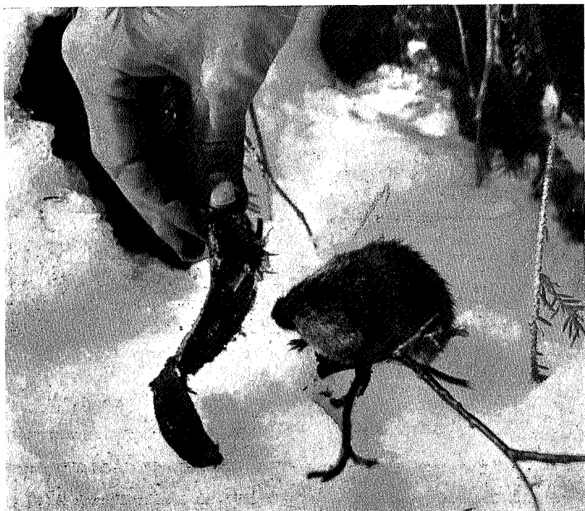
Appelsin — værsågod!