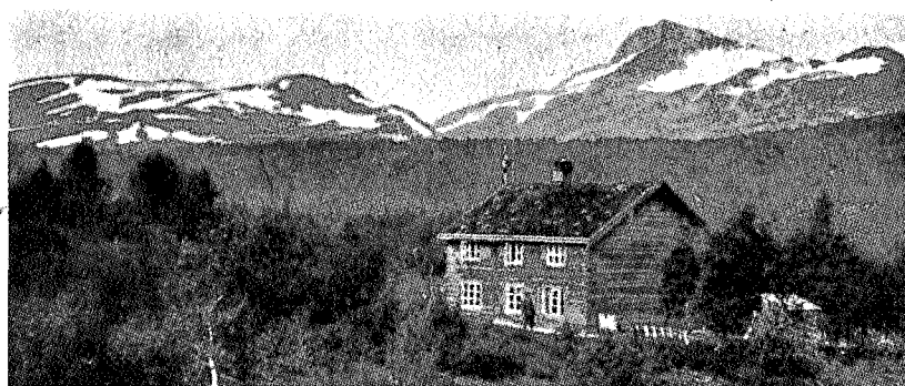
Trollheimshytta 1890. 12 senger