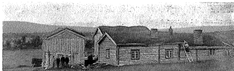
Nedalen gård 1890. 5 senger