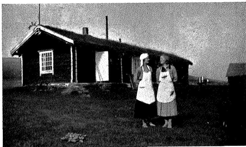
Turistforeningens stasjon ved Fjell-læger.

Fjell-lægeret over Lille Orkla. Fra Orkelsjøhytten kan turen gjøres enten nordom Store Orkelhø eller over toppen av denne om osen ved Lille Orkelsjø til Fjell-lægeret. Istedetfor å gå fra Kvitdalen til Borkhus, kan man gå om Flomsæter hvor prektig losji, om Furuhovdssæter gjennom Undalen inntil man treffer veien fra Opdal til Orkelsjøhytten, ca. 1½ km. vest for Orkelsjøen. Fra Kari-lægeret, hvor der er godt losji, kan man ta vei over Elgsjøtangen, gjennom Vinstradalen til Rise skysstasjon i Opdal.