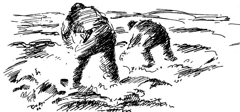
Det er et hundeliv å sanke reinsmose.

En kamp for livet uavladelig, under harde kår i en lang og grå kvardag.