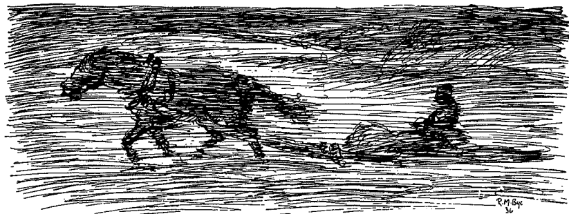
Et endeløst slit for hest og kar i snøstorm.

og leven i fjøset den første morgenen. Kyr sliter i bandet og fatter ikke innestengselen. Småfeet river fôret ut av krubbene og trækker det ned. Enda har de en minnelse i kroppen og grasgrønne bløgder inne på vidda.