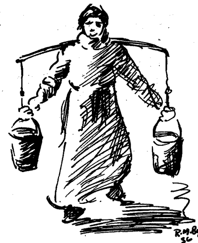
Vann skal bæres —