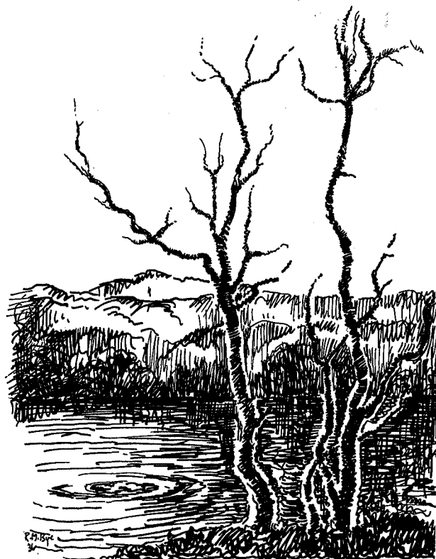
Svartblanke tjønner med aurevak — —