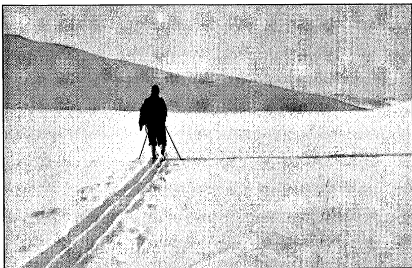
Eftermiddag på fjellet.

duftende renbiff, store gule multer, tyri på peisen, valgresultater fra Tyskland, værmelding — alt dette hadde dagen enda å gi oss.