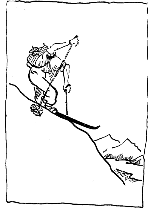
Umak som lønner sig.

På neste dags tur skremte vi op et elgpar som dermed la iveri i dysneen opover mot Trollhetta, og en halv time etter var de utenfor synsvidde. Vi selv brukte flere timer på den samme strek-