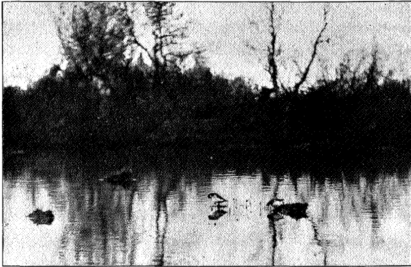
Svømmesneppeidyll fra Fokstummyra.

den behøver ikke å frykte for at den travle akerdyrker i tidens løp skal bortlede dens vann, dens altomformende plog forandre dens utseende, heller ikke noensinde larmen av en hurtig rullende dampvogn skal forstyrre dens vante ro og forskrekke de levende vesener, hvis forsørgelse er den anbetrodd».