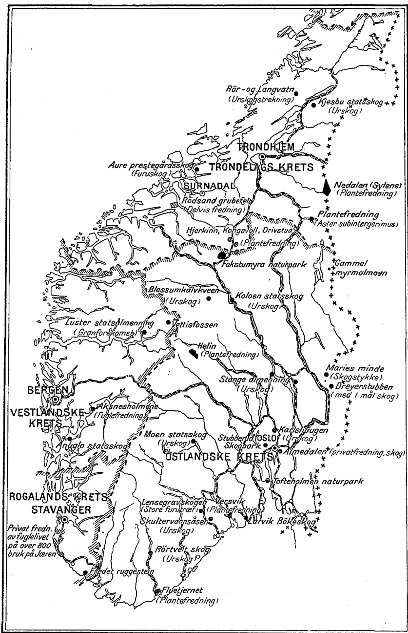
Kart over Naturfredningsforeningens virke i det sydlige Norge.