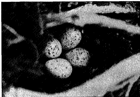
Egg av Fiskelita.

vært veldige erupsjoner med oppbygning av mektige vulkaner over hele Oslofeltet. Hovedvulkanen antas å ha hevet sig til ca. 4000 m. høide, men om den har ligget akkurat der hvor Tofteholmen nu ligger eller noe ut til siden, er uvisst. I et lite særskrift som fulgte vår årsberetning for