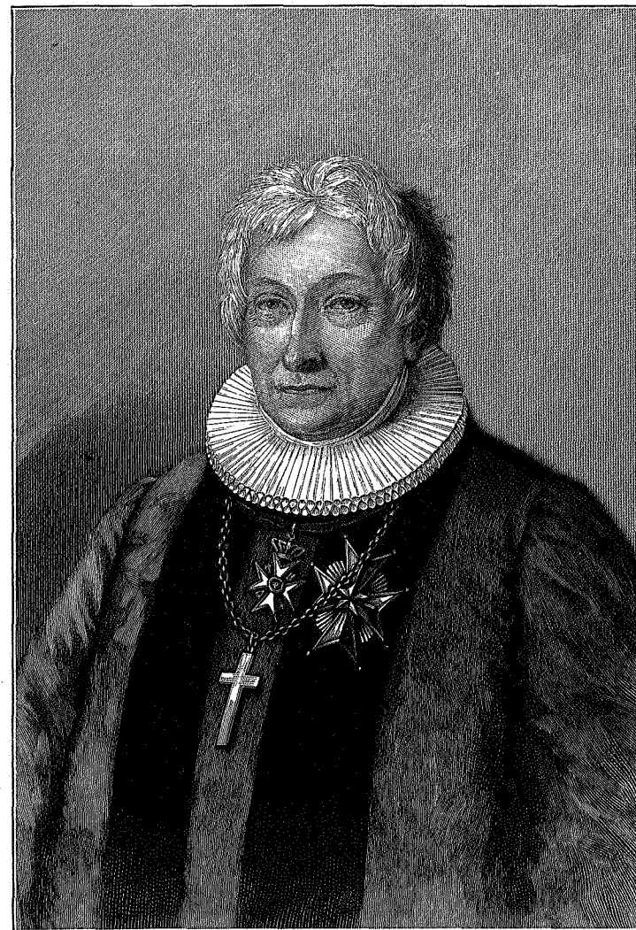
Efter et Lithografi af en Anonym.